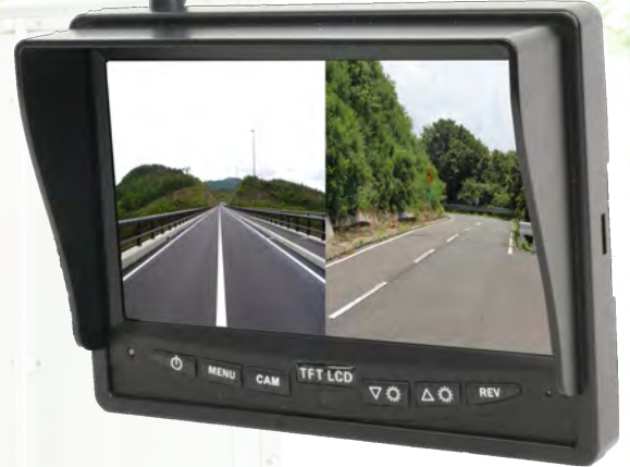
7型ワイドモニター

マグネットブラケットで金属面に固定するだけ！ お手持ちの車両にバックカメラシステムを手早く導入。