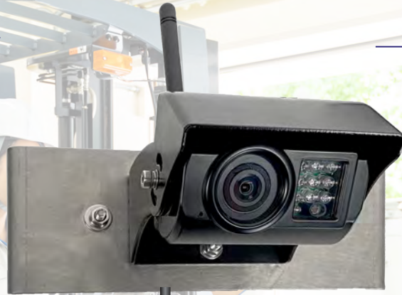
ワイヤレスカメラ